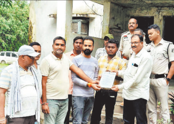
ज्ञापन सौंपते कांग्रेसी।