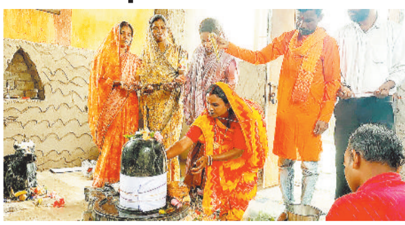
पूजा-अर्चना करती श्रद्धालु।