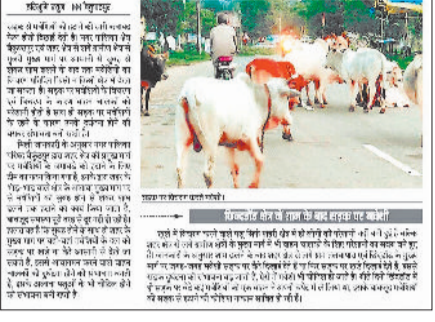
सड़क पर मवेशियों के विचरण के कारण वाहन चालकों को परेशानी

हरिभूमि में प्रकाशित खबर। विभागीय अधिकारियों को निर्देशित किया कि वे अपने-अपने कार्यक्षेत्र में इस आदेश का कड़ाई से पालन सुनिश्चित करें तथा की जा रही कार्रवाईयों की जानकारी समय-समय पर उच्च अधिकारियों को उपलब्ध कराएं। यह आदेश पुलिस अधीक्षक, सीईओ जिला पंचायत, सभी अनुविभागीय अधिकारी, लोक निर्माण विभाग, पशु चिकित्सा सेवाएं, आरटीओ, तहसीलदार, जनपद पंचायत एवं नगर पालिका अधिकारियों को भेजा गया है।